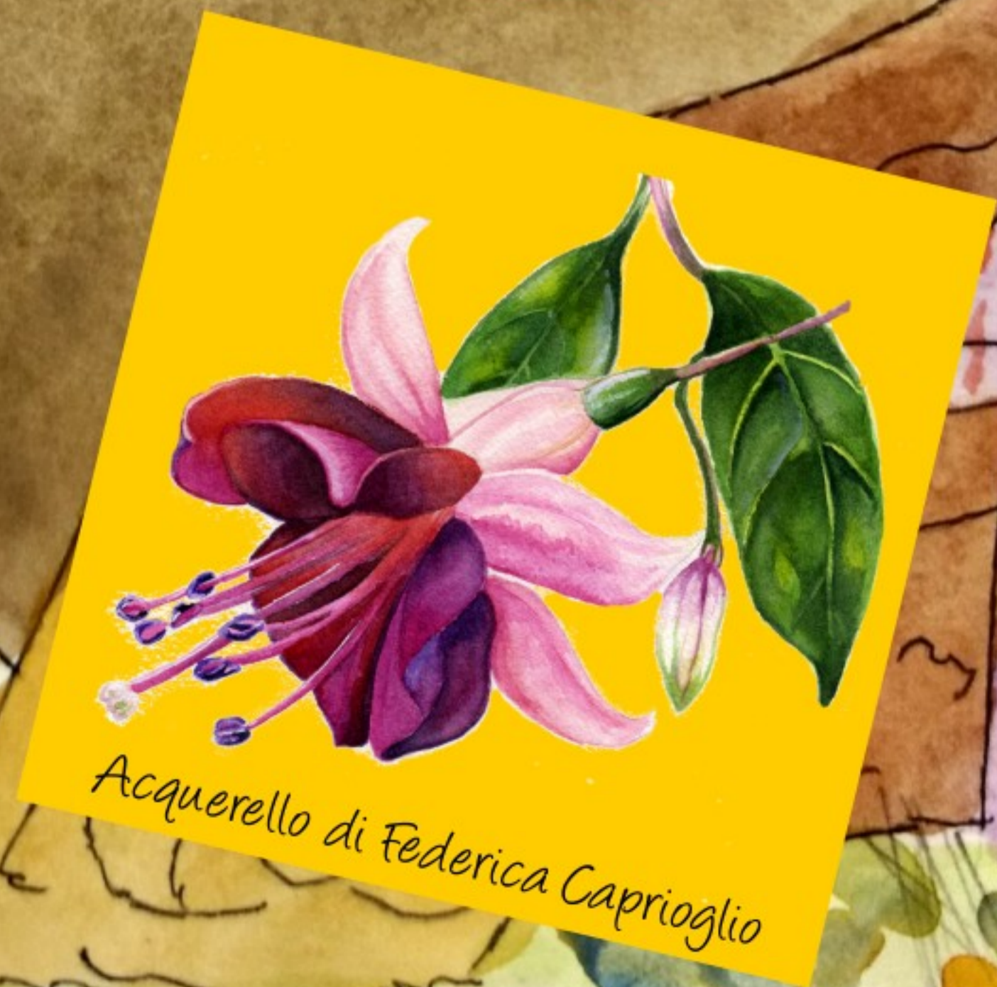
Acquerello di Federica Caprioglio